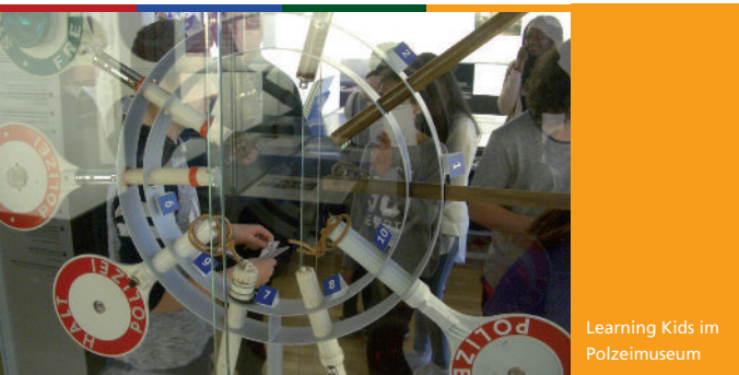
Learning Kids im Polizeimuseum

SchülerInnen bekommen durch Learning Kids die Möglichkeit, Einblicke in die Kultur- und Arbeitswelt unserer Stadt zu gewinnen und konkrete Berufsbilder und außerschulische Lernorte kennenzulernen.