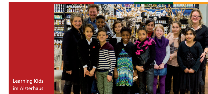
Learning Kids im Alsterhaus

Klasse 7: "Wir mussten eine fiktive Automarke erfinden und Personal in unserer Gruppe benennen. Dann haben wir ein Konzept erstellt und einen Prototypen gebaut."